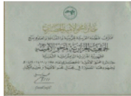
Prix Arabe d'Alphabétisation