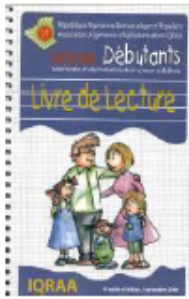
Planning familial ( Français Arabe)