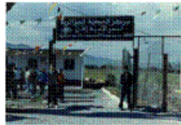
Sidi Hammad –Blida–