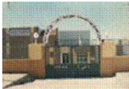
Centre AFIF Ain Touza –Batna–