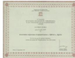
Prix International d'Alphabétisation Nomma