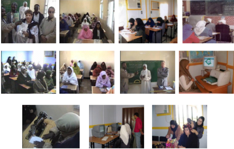
ILLUSTRATION DE QUELQUES CLASSES et Atelier DE IQRAA