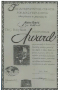
Prix Roby Kidd