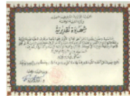
Prix Arabe d'Alphabétisation