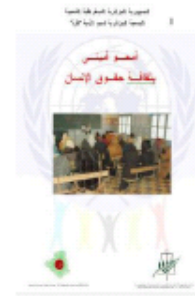
Les Droits de l'Homme