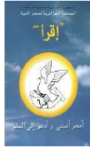
Culture de la Paix