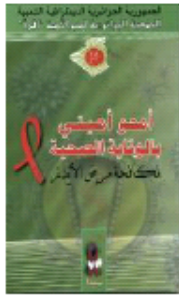
La prévention sanitaire et lutte Contre le VIH SIDA